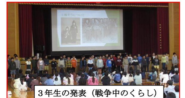
3年生の発表（戦争中の暮らし）

わたしは、4年生の発表を聞いて、大阪大空しゅうがおきたことをはじめて知りました。わたしが、平和のためにできることは、けんかをせずに友だちとなかよくしたり、人にやさしくすることだと思います。なぜなら、けんかもとても小さなせんそうのようなものだと思うからです。わたしにとってせんそうとは、人の命がうばわれていく苦しい場所だと思います。なので、せんそうのない平和な世界になってほしいです。そのために、わたしたちで少しでも平和な世界にしていけたらいいなと思いました。