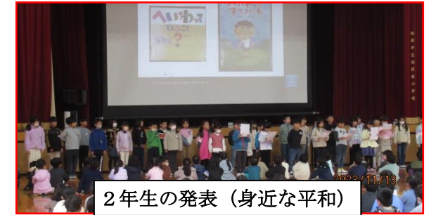
2年生の発表（身近な平和）

きてほしくなくて、へいわをつくろうとおもいました。それで、へいわしゅうかいはやっぱりあっていいなとおもいました。でも、やっぱりせんそうはもうぜったいしないほうがいいなとおもいました。わたしたちがへいわにしていこうとおもいます。