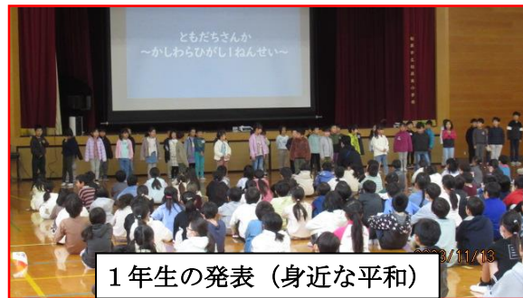
1年生の発表（身近な平和）

「へいわ」ってまもりたいな。ばくだんにひとがころされてしんじゃってかなしい。おきなわで人もむしたちもしんじゃってかなしい。学校が、ばくだんでみんなころされたくないな。みんなのまちをぼろぼろにしたくない。人にひこうきからばくだんをおとして、人をころしたくない。